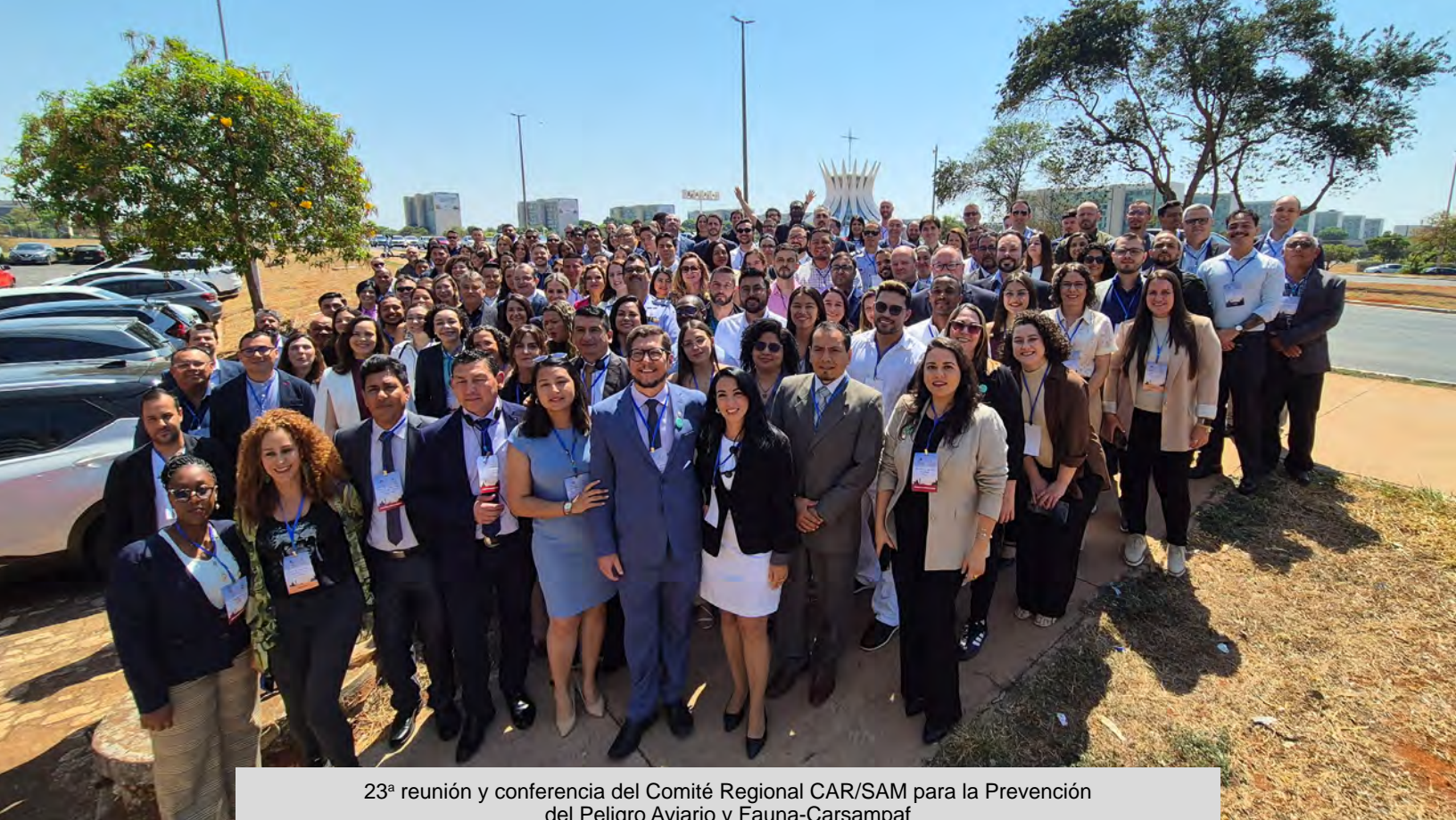
23ª reunión y conferencia del Comité Regional CAR/SAM para la Prevención del Peligro Aviario y Fauna-Carsampaf Brasilia - Brasil 2025